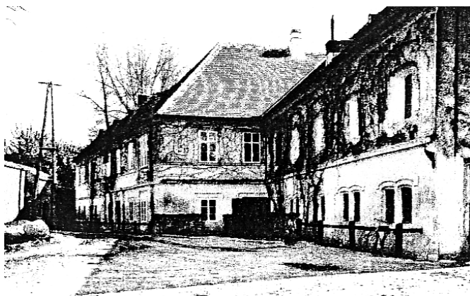
Historické fotografie budov mlýna