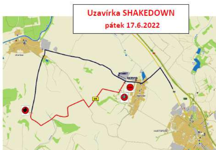
RZ 1, 4 Vičí dolina – 17.06.2022